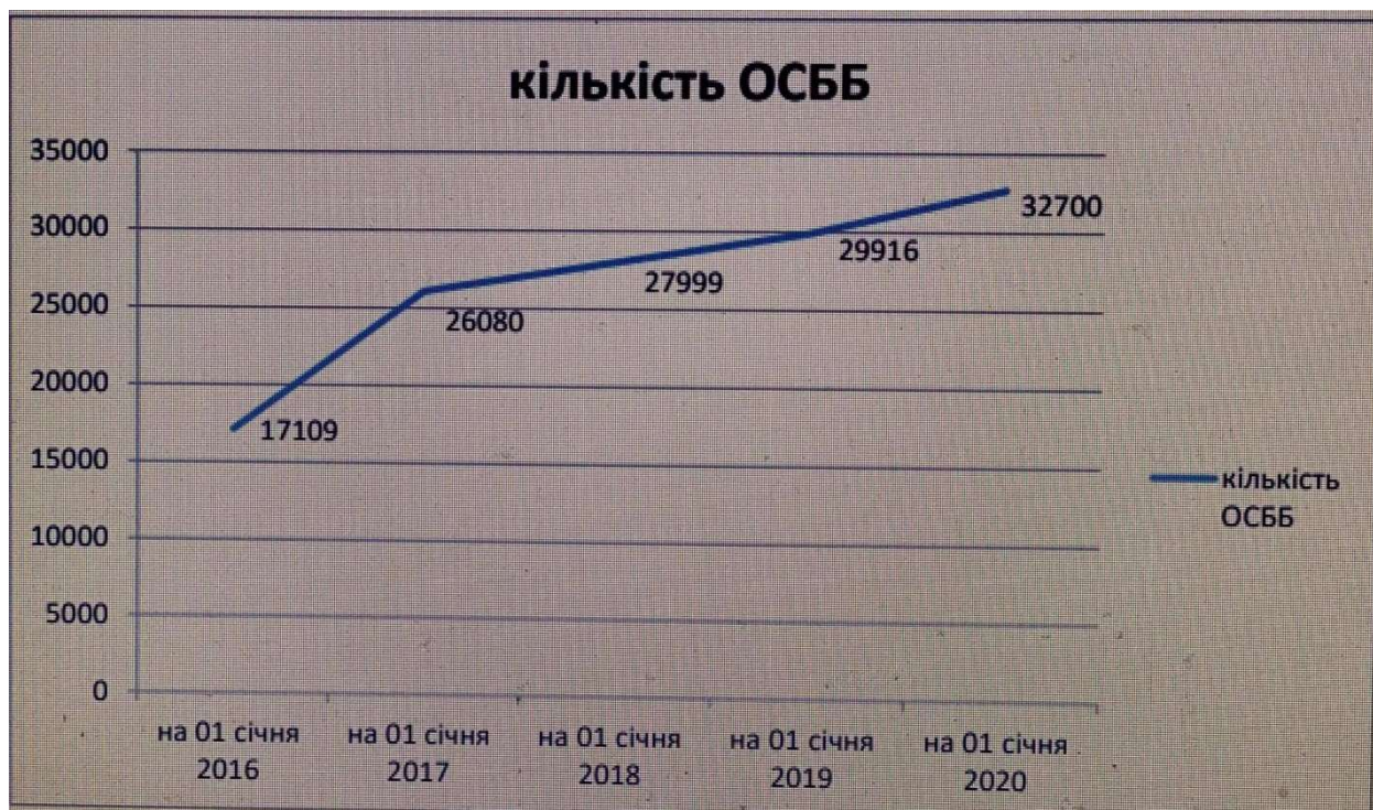
Рис.1 – Кількість створених ОСББ за період 2016 - 2019 рр.

ОСББ може бути створено лише власниками квартир і нежитлових приміщень у багатоквартирному будинку. Установчі збори об'єднання в новозбудованих багатоквартирних будинках можуть бути проведені після державної реєстрації права власності на більше половини квартир і нежитлових приміщень у такому будинку. Для створення об'єднання скликаються установчі збори. Наразі кожен співвласник квартири у будинку вважається членом ОСББ. Загальні збори співвласників будинку, своєю чергою, є вищим органом управління ОСББ. Динаміка створення ОСББ наведена на рис.1.